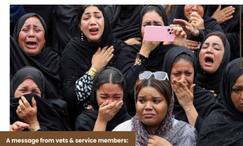
A message from vets & service members:

Vejen ud er naturligvis ikke helt så nem og ligetil, men centret har lang erfaring med opgaven, for det blev oprettet op til Den Anden Verdenskrig. .tom